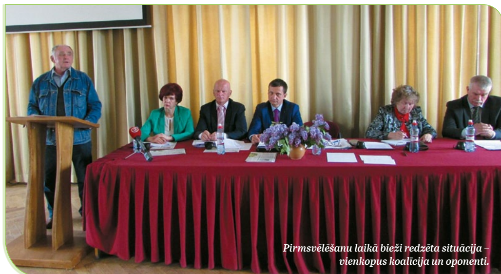
Pirmsvēlēšanu laikā bieži redzēta situācija – vienkopus koalīcija un oponenti.

To, ka valstij jāmeklē nauda ne tikai iedzīvotāju maciņos, piekrist visi. Tas, ka pensionāri bieži vairs nespēj izturēt valsts uzlikto slogu un tas ietekmē viņu aiziešanas paātrināšanu, arī visiem skaidrs. Tad kāpēc valsts pārvaldes līmenī neko negrib darīt? Vai valsts politikas nostādne neoficiāli ir paātrināt pensionāru aiziešanu no dzīves? ♥