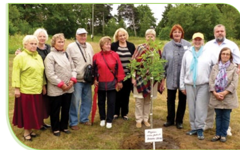
LPF iedibina tradīciju katrā Piejūras festivāla pasākumā iestādīt pa piemiņas kokam senioru kopības saliedēšanai.