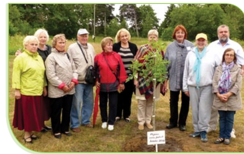
LPF iedibina tradīciju katrā Piejūras festivālā pasākumā iestādīt pa piemiņas kokam senioru kopības saliedēšanai.