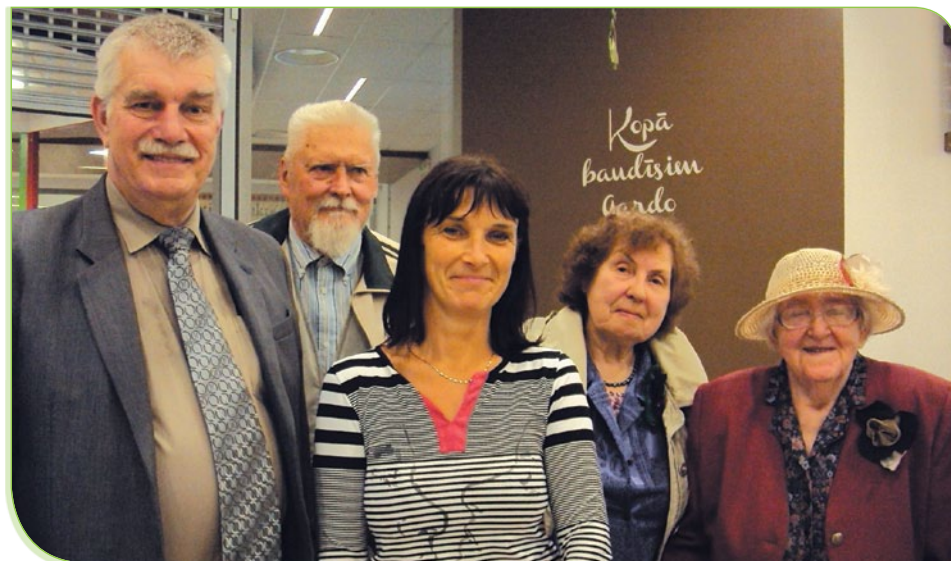
Foto no Jēkabpils valdes sēdes. Neformālās tikšanās laikā ar Jēkabpils aktīvistiem.