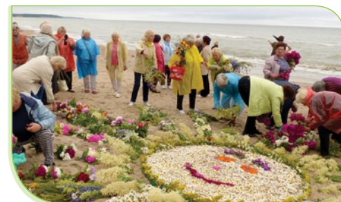
Festivāla noslēgumā dalībnieku izveidotā ziedu saule Jūrkalnes krasta kāpās.