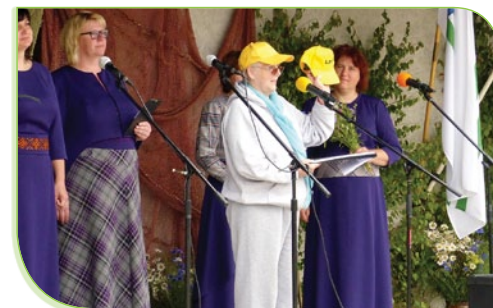
Festivāla atklāšanas ceremonijā Ventspils novada priekšsēdētājam tiek pasniegta cepurīte ar LPF simbolu un vēlējumu turēt to redzamā vietā, vienmēr atcerēties senioru ikdienas jautājumu risināšanu.

Lai arī todien daudzviet lija, laika apstākļi mūs saudzēja - Jūrkalne gādāja par festivāla dalībnieku labsajūtu. Mūs vienoja dziesmas, dejas, labi vārdi un draudzīgas sarunas. Uz tikšanos nākamgad Pāvilostā! ♥